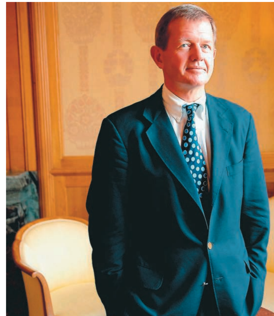
SEB:s ordförande Marcus Wallenberg, här på bankens huvudkontor i Stockholm, är nyss hemkommen från en studieresa i New Delhi med drygt 50 nordiska företagsledare.